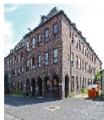
Fotonummer F 09218690 C Aufnahmejahr 2015 Beschreibung Verwaltungsgebäude