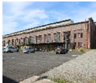
Fotonummer F 09218690 A Aufnahmejahr 2015 Beschreibung Werkhallen

Ausweisungsstelle Landesamt für Denkmalpflege Sachsen