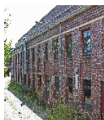
Fotonummer F 09218690 E Aufnahmejahr 2015 Fotograf Speckhals, Frank Beschreibung Werkhalle, straßenseitige Fassade, Detail