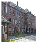
Fotonummer F 09218690 B Aufnahmejahr 2015 Beschreibung Verwaltungsgebäude