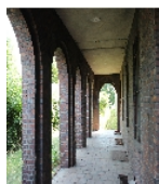
Fotonummer F 09218690 D Aufnahmejahr 2015 Beschreibung Verwaltungsgebäude, Arkaden