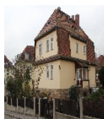
Fotonummer F 09218556 A Aufnahmejahr 2013 Beschreibung Einfamilienwohnhaus