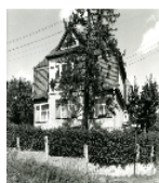
Fotonummer DF 459 333 Aufnahmejahr 1994 Beschreibung Einfamilienhaus