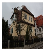
Fotonummer F 09218556 B Aufnahmejahr 2013 Beschreibung Einfamilienwohnhaus