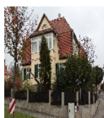
Fotonummer F 09218556 C Aufnahmejahr 2013 Beschreibung Einfamilienwohnhaus