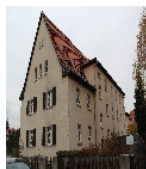
Fotonummer F 09218543 A Aufnahmejahr 2013 Beschreibung Doppelwohnhaus