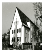
Fotonummer XCVII/3/16 Aufnahmejahr Fotograf Beschreibung