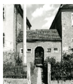
Fotonummer DF 459 331 Aufnahmejahr Fotograf Beschreibung