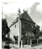
Fotonummer DF 459 328 Aufnahmejahr Fotograf Beschreibung