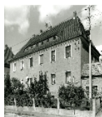
Fotonummer DF 459 329 Aufnahmejahr Fotograf Beschreibung