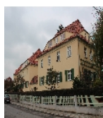
Fotonummer F 09218533 A Aufnahmejahr 2013 Beschreibung Wohnhausgruppe und Einfriedung, Ansicht mit Nr. 2 im Vordergrund