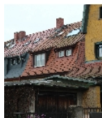
Fotonummer F 09218522 B Aufnahmejahr 2013 Beschreibung Einfamilienwohnhaus eines Reihenzwischenhauses