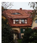
Fotonummer F 09218522 A Aufnahmejahr 2013 Beschreibung Einfamilienwohnhaus eines Reihenzwischenhauses