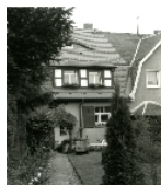
Fotonummer XCIX/16/2 Aufnahmejahr Fotograf Beschreibung