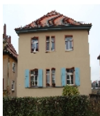
Fotonummer F 09218514 B Aufnahmejahr 2013 Beschreibung Wohnhaus, Frontalansicht