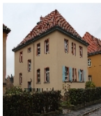
Fotonummer F 09218514 A Aufnahmejahr 2013 Beschreibung Wohnhaus