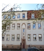
Fotonummer F 09218501 F Aufnahmejahr 2017 Beschreibung Häuserzeile