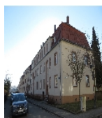
Fotonummer F 09218501 C Aufnahmejahr 2017 Beschreibung Häuserzeile