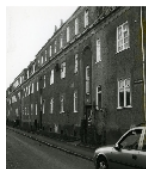
Fotonummer XCIV/84/20 Aufnahmejahr 2001 Beschreibung Häuserzeile