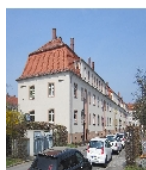
Fotonummer F 09218501 A Aufnahmejahr 2013 Fotograf Giorgio Michele Beschreibung Häuserzeile - wikipedia-Foto