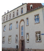
Fotonummer F 09218501 D Aufnahmejahr 2017 Beschreibung Häuserzeile