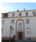
Fotonummer F 09218501 E Aufnahmejahr 2017 Beschreibung Häuserzeile