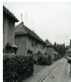
Fotonummer DF 490 893 Aufnahmejahr 1995 Beschreibung Reihenhaus