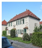
Fotonummer F 09218458 A Aufnahmejahr 2013 Fotograf Giorgio Michele Beschreibung Reihenhaus - wikipedia-Foto