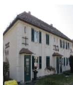
Fotonummer F 09218458 C Aufnahmejahr 2017 Beschreibung Reihenhaus