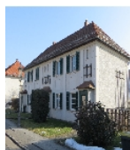
Fotonummer F 09218458 B Aufnahmejahr 2017 Beschreibung Reihenhaus