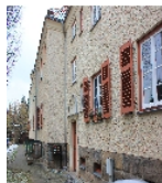
Fotonummer F 09218308 B Aufnahmejahr 2015  Beschreibung Häuserzeile (siehe Gmünder Straße 1-7), rückwärtige Eingangsseite Nr. 5