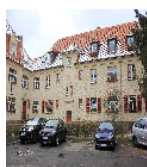
Fotonummer F 09218308 E Aufnahmejahr 2015 Beschreibung Häuserzeile (siehe Gmünder Straße 1-7), Straßenfront mit Hauseingängen Nr. 13 und Nr. 15