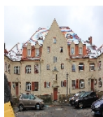
Fotonummer F 09218308 D Aufnahmejahr 2015 Beschreibung Häuserzeile (siehe Gmünder Straße 1-7), Straßenfront mit Hauseingängen von Nr. 9, 11 mit Giebel und Nr. 13