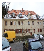
Fotonummer F 09218308 C Aufnahmejahr 2015 Beschreibung Häuserzeile (siehe Gmünder Straße 1-7), Straßenfront mit Hauseingängen von Nr. 7 und Nr. 9