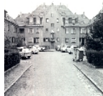
Fotonummer DF 409 023 Aufnahmejahr Fotograf Beschreibung