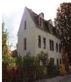
Fotonummer F 09218109 C Aufnahmejahr 2013 Beschreibung Wohnhaus