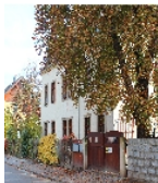
Fotonummer F 09218109 B Aufnahmejahr 2013 Beschreibung Wohnhaus