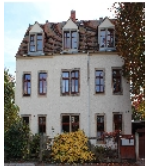
Fotonummer F 09218109 A Aufnahmejahr 2013 Beschreibung Wohnhaus