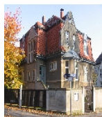
Fotonummer F09217923 A Aufnahmejahr 2011 Beschreibung Villa