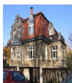
Fotonummer F09217923 C Aufnahmejahr 2011 Beschreibung Villa