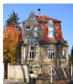
Fotonummer F09217923 B Aufnahmejahr 2011 Beschreibung Villa