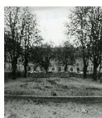
Fotonummer DF 414 394 Aufnahmejahr 1992 Beschreibung Wohnblock, Hofseite