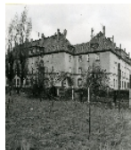
Fotonummer DF 414 397 Aufnahmejahr 1992 Beschreibung Wohnblock

Ausweisungsstelle Landesamt für Denkmalpflege Sachsen