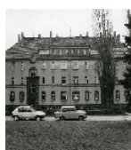
Fotonummer DF 414 393 Aufnahmejahr 1992 Beschreibung Wohnblock