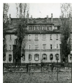
Fotonummer DF 414 396 Aufnahmejahr 1992 Beschreibung Wohnblock