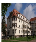
Fotonummer F 09217768 A Aufnahmejahr 2017 Beschreibung Häuserzeile - Hofseite