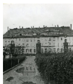
Fotonummer DF 414 395 Aufnahmejahr 1992 Beschreibung Wohnblock