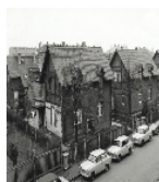
Fotonummer DF 452 684 Aufnahmejahr 1991 Beschreibung Reihenhäuser Nr. 3-9; Straßenansicht von NO