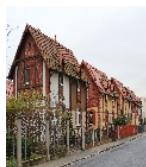
Fotonummer F 09217763 B Aufnahmejahr 2013 Beschreibung Doppelwohnhaus, Ansicht in Straßenlage mit Nr. 1/3 im Vordergrund