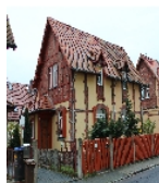
Fotonummer F 09217763 A Aufnahmejahr 2013 Beschreibung Doppelwohnhaus