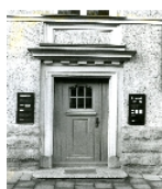
Fotonummer XLVIII/94/0 Aufnahmejahr Fotograf Beschreibung