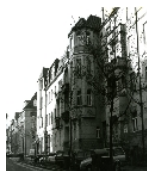
Fotonummer XLVIII/93/13 Aufnahmejahr Fotograf Beschreibung