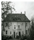
Fotonummer XCIX/99/27 Aufnahmejahr Fotograf Beschreibung