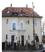
Fotonummer F 09216072 C Aufnahmejahr 2015 Beschreibung Doppelwohnhaus, Straßenfront Nr. 22