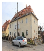
Fotonummer F 09216072 D Aufnahmejahr 2015 Beschreibung Doppelwohnhaus einer Siedlung der Baugenossenschaft Dresden-Land e.G.m.b.H., Ansicht mit Nr. 22 im Vordergrund