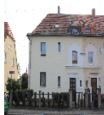
Fotonummer F 09216072 B Aufnahmejahr 2015 Beschreibung Doppelwohnhaus, Straßenfront Nr. 24