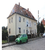
Fotonummer F 09216072 A Aufnahmejahr 2015 Beschreibung Doppelwohnhaus einer Siedlung der Baugenossenschaft Dresden-Land e.G.m.b.H., Ansicht mit Nr. 24 im Vordergrund