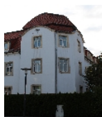
Fotonummer F 09215600 D Aufnahmejahr 2013 Beschreibung Mietshaus, Ansicht Eckgestaltung