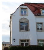
Fotonummer F 09215600 C Aufnahmejahr 2013 Beschreibung Mietshaus, Fassadendetail