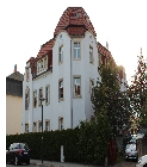
Fotonummer F 09215600 A Aufnahmejahr 2013 Beschreibung Mietshaus