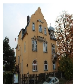
Fotonummer F 09215590 A Aufnahmejahr 2013 Beschreibung Kirchgemeindehaus