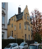
Fotonummer F 09215590 C Aufnahmejahr 2013 Beschreibung Kirchgemeindehaus, Ansicht mit östlicher Eingangsseite