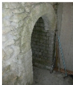
Fotonummer F 09211942 D Aufnahmejahr 2012 Beschreibung Gewölbekeller