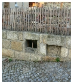
Fotonummer F 09211942 E Aufnahmejahr 2012 Beschreibung Gewölbekeller