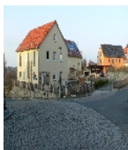
Fotonummer F 09211942 G Aufnahmejahr 2012 Beschreibung Ansicht des gesamten Anwesens