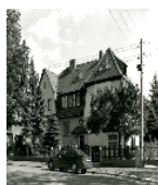
Fotonummer DF 459 327 Aufnahmejahr Fotograf Beschreibung