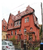
Fotonummer F 09210904 A Aufnahmejahr 2013 Beschreibung Reihenhhaus