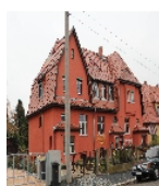
Fotonummer F 09210904 B Aufnahmejahr 2013 Beschreibung Reihenhhaus