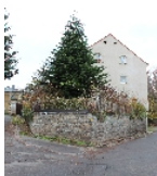
Fotonummer F 09210872 B Aufnahmejahr 2013 Beschreibung Wohnhaus, östlicher Giebel