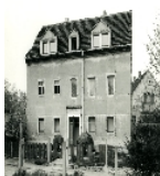
Fotonummer DF 413 175 Aufnahmejahr Fotograf Beschreibung