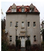
Fotonummer F 09210872 A Aufnahmejahr 2013 Beschreibung Wohnhaus, südliche Längsseite mit Portal und Inschrifttafel