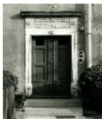
Fotonummer DF 413 176 Aufnahmejahr Fotograf Beschreibung