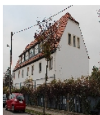
Fotonummer F 09210825 D Aufnahmejahr 2013 Beschreibung Wohnstallhaus, Längsseite zur Flensburger Straße