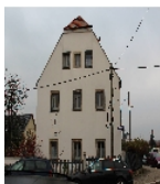
Fotonummer F 09210825 C Aufnahmejahr 2013 Beschreibung Wohnstallhaus, Straßengiebel