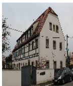
Fotonummer F 09210825 B Aufnahmejahr 2013 Beschreibung Wohnstallhaus

Ausweisungsstelle Landesamt für Denkmalpflege Sachsen