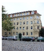
Fotonummer F 09210684 D Aufnahmejahr 2015 Beschreibung Häuserzeile, Straßenfront Nr. 20