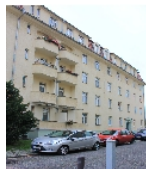
Fotonummer F 09210684 B Aufnahmejahr 2015 Beschreibung Häuserzeile, Straßenfront Nr. 18