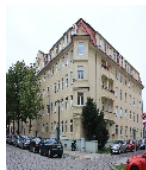
Fotonummer F 09210684 A Aufnahmejahr 2015 Beschreibung Häuserzeile, Gesamtansicht