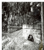
Fotonummer LXXXIII/84/22 Aufnahmejahr Fotograf Beschreibung