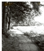
Fotonummer LXXXIII/84/21 Aufnahmejahr Fotograf Beschreibung