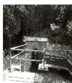
Fotonummer LXXXIII/84/25 Aufnahmejahr Fotograf Beschreibung