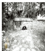
Fotonummer LXXXIII/84/23 Aufnahmejahr Fotograf Beschreibung