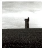
Fotonummer LXXXIII/81/16 Aufnahmejahr Fotograf Beschreibung