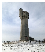
Fotonummer F 09209014 D Aufnahmejahr 2014 Beschreibung Wasserturm