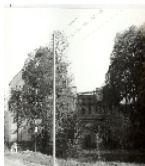
Fotonummer Aufnahmejahr Fotograf Beschreibung