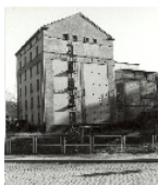
Fotonummer Aufnahmejahr Fotograf Beschreibung

Hauptgebäude der alten Mühle und Hauptgebäude der neuen Mühle mit Zwillingsturbine sowie Mühlgraben vom Abzweig von der Würschnitz bis zum Wiedereinlauf, inklusive vier Wehranlagen, Überlaufgraben, Zuläufen aus den angrenzenden Feldern und begleitendem Baumbestand