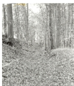
Fotonummer Aufnahmejahr Fotograf Beschreibung

Hauptgebäude der neuen Mühle angrenzenden Feldern und begleitendem Baumbestand