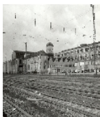
Fotonummer LIII/87/15 Aufnahmejahr Fotograf Beschreibung Fabrikanlage mit großer Shedhalle (Haus A), Galeriehalle (Haus B), Uhrturm und kleinem frei stehenden Vorbau (Waage?) (Haus C), kleiner Shedhalle (Haus D), mehrgeschossigem Fertigungsgebäude (Haus E) sowie Nebengebäude/Versandhaus (Haus F), (Heizhaus, Pfortnerhaus und Kulturhaus 2004 abgebrochen)