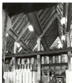
Fotonummer LIII/87/5 Aufnahmejahr Fotograf Beschreibung