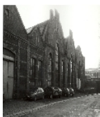
Fotonummer LIII/87/11 Aufnahmejahr Fotograf Beschreibung Fabrikanlage mit großer Shedhalle (Haus A), Galeriehalle (Haus B), Uhrturm und kleinem frei stehenden Vorbau (Waage?) (Haus C), kleiner Shedhalle (Haus D), mehrgeschossigem Fertigungsgebäude (Haus E) sowie Nebengebäude/Versandhaus (Haus F), (Heizhaus, Pfortnerhaus und Kulturhaus 2004 abgebrochen)