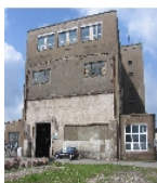
Fotonummer F 09203530 C Aufnahmejahr 2009 Beschreibung Gebäude E: östliche Stirnseite