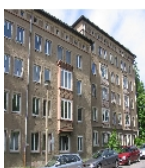
Fotonummer Aufnahmejahr Fotograf Beschreibung

Einzeldenkmale der Sachgesamtheit Wiederaufbauggebiet Reitbahnstraße: Wohnhauszeilen eines Wohngebietes, Nr. 8 und Nr. 10-14 (gerade), entstanden im Rahmen einer einheitlichen Gesamtplanung (siehe Sachgesamtheitsliste Reitbahnstraße - Obj. 09302590)