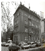
Fotonummer Aufnahmejahr Fotograf Beschreibung

Einzeldenkmale der Sachgesamtheit Wiederaufbauggebiet Reitbahnstraße: Wohnhauszeilen eines Wohngebietes, Nr. 8 und Nr. 10-14 (gerade), entstanden im Rahmen einer einheitlichen Gesamtplanung (siehe Sachgesamtheitsliste Reitbahnstraße - Obj. 09302590)