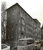
Fotonummer Aufnahmejahr Fotograf Beschreibung