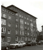
Fotonummer Aufnahmejahr Fotograf Beschreibung

Einzeldenkmale der Sachgesamtheit Wiederaufbauggebiet Reitbahnstraße: Wohnhauszeilen eines Wohngebietes, Nr. 8 und Nr. 10-14 (gerade), entstanden im Rahmen einer einheitlichen Gesamtplanung (siehe Sachgesamtheitsliste Reitbahnstraße - Obj. 09302590)