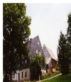
Fotonummer XCIX/39/10 Aufnahmejahr 2003 Beschreibung Wohnstallhaus