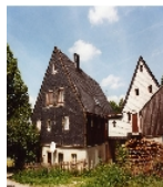
Fotonummer XCIX/39/9 Aufnahmejahr 2003 Beschreibung Wohnstallhaus