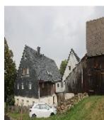
Fotonummer F 08992188 A Aufnahmejahr 2018 Beschreibung Wohnstallhaus - Ansicht von SW