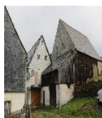
Fotonummer F 08992188 B Aufnahmejahr 2018 Beschreibung Hintergebäude eines Bauernhofes - kein Denkmal