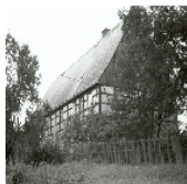
Fotonummer XCIX/23/14 Aufnahmejahr Fotograf Beschreibung