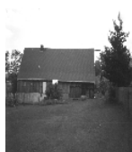
Fotonummer LIV/27/13 Aufnahmejahr 1996 Beschreibung Wohnstallhaus, Rückseite