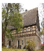
Fotonummer F 08992021 A Aufnahmejahr 2018 Beschreibung Wohnstallhaus mit integriertem Scheunenteil - Ansicht von SO