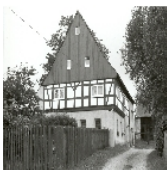
Fotonummer XCIX/23/9 Aufnahmejahr Fotograf Beschreibung