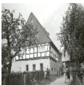
Fotonummer LIV/73/8A Aufnahmejahr 1996 Beschreibung Wohnstallhaus (Obergeschoss Fachwerk) und Scheune eines Bauernhofes