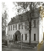
Fotonummer LXVIII/74/21 Aufnahmejahr Fotograf Beschreibung