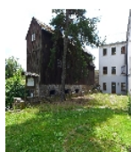
Fotonummer F 08991180 B Aufnahmejahr 2015 Beschreibung Teichmühle, Hofansicht mit Seitengebäude links, davor Mühlgraben