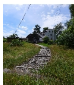
Fotonummer F 08991180 A Aufnahmejahr 2015 Beschreibung Teichmühle mit Mühlgraben (Untergraben), Ansicht von Norden