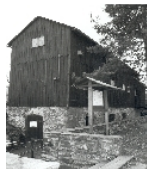
Fotonummer XCIII/70/2 Aufnahmejahr Fotograf Beschreibung