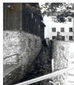
Fotonummer XCIII/70/3 Aufnahmejahr Fotograf Beschreibung