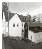
Fotonummer LXVIII/74/22 Aufnahmejahr Fotograf Beschreibung