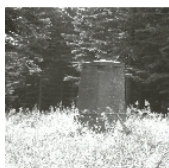
Fotonummer XCIII/56/20A Aufnahmejahr Fotograf Beschreibung