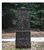
Fotonummer F 08990828 A Aufnahmejahr 2011 Beschreibung Triangulationsstein, Station 2. Ordnung