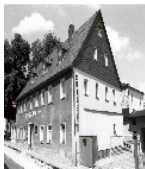
Fotonummer XCIII/77/20 Aufnahmejahr Fotograf Beschreibung