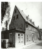
Fotonummer DF 722 259 Aufnahmejahr 1992 Beschreibung Gasthof, Eckansicht