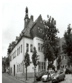
Fotonummer XCIII/76/9 Aufnahmejahr Fotograf Beschreibung