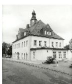
Fotonummer DF 722 364 Aufnahmejahr 1992 Beschreibung Rathaus, Straßenansicht von SW