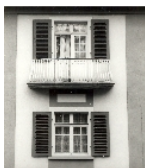
Fotonummer DF 407 753 Aufnahmejahr Fotograf Beschreibung