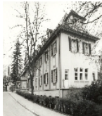
Fotonummer DF 407 752 Aufnahmejahr Fotograf Beschreibung