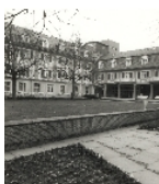
Fotonummer DF 407 755 Aufnahmejahr Fotograf Beschreibung