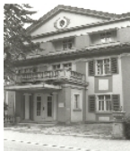
Fotonummer LXXXII/66/28 Aufnahmejahr 2000 Beschreibung Kurhaus