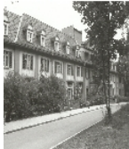
Fotonummer LXXXII/66/29 Aufnahmejahr 2000 Beschreibung Kurhaus