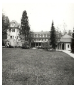
Fotonummer DF 407 754 Aufnahmejahr Fotograf Beschreibung