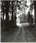
Fotonummer LXXXI/56/0 Aufnahmejahr Fotograf Beschreibung