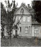
Fotonummer LXXXI/50/34 Aufnahmejahr Fotograf Beschreibung