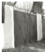
Fotonummer LXXXVIII/18/31 Aufnahmejahr Fotograf Beschreibung