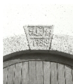
Fotonummer LXXXVIII/18/35 Aufnahmejahr Fotograf Beschreibung