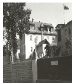
Fotonummer LXXXVIII/18/29 Aufnahmejahr Fotograf Beschreibung