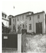
Fotonummer LXXXVIII/18/28 Aufnahmejahr Fotograf Beschreibung