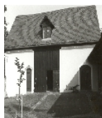
Fotonummer LXXXVIII/18/34 Aufnahmejahr Fotograf Beschreibung