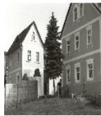
Fotonummer LXXXVIII/18/30 Aufnahmejahr Fotograf Beschreibung