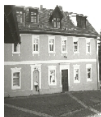
Fotonummer LXXXVIII/18/33 Aufnahmejahr Fotograf Beschreibung