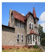
Fotonummer F 08974181 A Aufnahmejahr 2016 Beschreibung Herrenhaus, Ansicht von Südosten mit Eingangsbereich