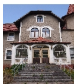
Fotonummer F 08974181 B Aufnahmejahr 2016 Beschreibung Herrenhaus, Ansicht des Haupteingangs von Südosten