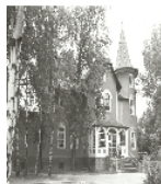
Fotonummer LXXIX/92/26 Aufnahmejahr Fotograf Beschreibung