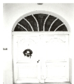
Fotonummer LXXIX/92/28 Aufnahmejahr Fotograf Beschreibung