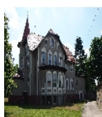
Fotonummer F 08974181 C Aufnahmejahr 2016 Beschreibung Herrenhaus, Rückseite von Nordwesten