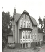
Fotonummer LXXIX/92/25 Aufnahmejahr Fotograf Beschreibung