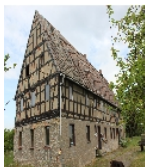
Fotonummer F 08971912 B Aufnahmejahr 2016 Beschreibung Wohnstallhaus eines Bauernhofes