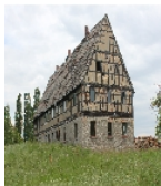
Fotonummer F 08971912 A Aufnahmejahr 2016 Beschreibung Wohnstallhaus eines Bauernhofes