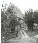
Fotonummer LXVIII/43/18 Aufnahmejahr Fotograf Beschreibung