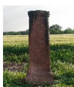
Fotonummer F 08971477 A Aufnahmejahr 2011 Beschreibung Triangulationsstein 2. Ordnung