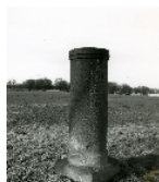
Fotonummer XCII/50/8 Aufnahmejahr Fotograf Beschreibung