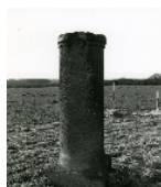
Fotonummer XCII/50/7 Aufnahmejahr Fotograf Beschreibung