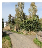
Fotonummer F 08971195 E Aufnahmejahr 2012 Beschreibung Einfriedung