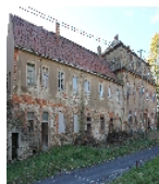
Fotonummer F 08971195 C Aufnahmejahr 2012 Beschreibung Herrenhaus und Nebengebäude