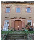
Fotonummer F 08971195 B Aufnahmejahr 2012 Beschreibung Herrenhaus, Portal