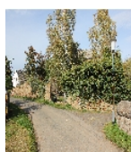
Fotonummer F 08971195 E Aufnahmejahr 2012 Beschreibung Einfriedung