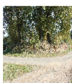
Fotonummer F 08971195 F Aufnahmejahr 2012 Beschreibung Einfriedung