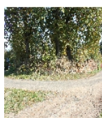
Fotonummer F 08971195 F Aufnahmejahr 2012 Beschreibung Einfriedung