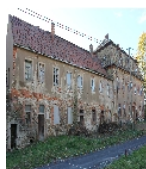
Fotonummer F 08971195 C Aufnahmejahr 2012 Beschreibung Herrenhaus und Nebengebäude