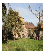
Fotonummer F 08971195 D Aufnahmejahr 2012 Beschreibung Herrenhaus und Nebengebäude