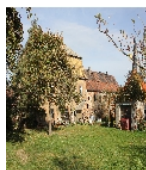
Fotonummer F 08971195 D Aufnahmejahr 2012 Beschreibung Herrenhaus und Nebengebäude