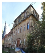
Fotonummer F 08971195 A Aufnahmejahr 2012 Beschreibung Herrenhaus

Ausweisungsstelle Landesamt für Denkmalpflege Sachsen