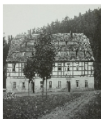
Fotonummer Aufnahmejahr Fotograf Beschreibung

Zufahrt zur ehemaligen Spinnerei Himmelmühle, links Mühlgraben, rechts verdeckt der (abgebrochene) Gartenpavillion des Herrenhauses