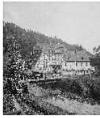
Fotonummer Aufnahmejahr Fotograf Beschreibung

Blick von NO auf die ehemalige Spinnerei Himmelmühle mit ehem. Spinnereigebäude, davor links Langes Haus (Wohnhaus), rechts Kurzes Haus, davor Zschopau mit Straßenbrücke (Stahlträger, A 20. Jh.)