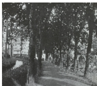
Fotonummer Aufnahmejahr Fotograf Beschreibung

Blick von Süden auf die ehemalige Spinnerei Himmelmühle mit Mühlgraben, Schornstein und Kesselhaus, im Hintergrund Fabrikgebäude