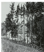
Fotonummer Aufnahmejahr Fotograf Beschreibung

Kurzes Haus (mit kleinem Nebengebäude), Langes Haus, ehem. Schule (teilweise) (v.l.n.r.)