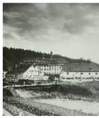
Fotonummer Aufnahmejahr Fotograf Beschreibung