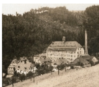
Fotonummer Aufnahmejahr Fotograf Beschreibung

Blick von Süden (Standort im Fabrikgelände) auf das Lange Haus (Wohnhaus) der ehemaligen Spinnerei Himmelmühle, rechts angeschnitten Herrenhaus, links Weifen- und Lagerhaus sowie Hopfpflasterung