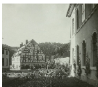
Fotonummer Aufnahmejahr Fotograf Beschreibung