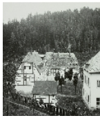
Fotonummer Aufnahmejahr Fotograf Beschreibung

Blick von NO auf die ehemalige Spinnerei Himmelmühle mit ehem. Spinnereigebäude, davor links Langes Haus (Wohnhaus), rechts Kurzes Haus, davor Zschopau mit Straßenbrücke (Stahlträger, A 20. Jh.)