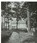
Fotonummer Aufnahmejahr Fotograf Beschreibung

Blick von Westen auf die (verdeckte) ehemalige Spinnerei Himmelmühle mit Fabrikgebäude, Schornstein sowie Dach des Kesselhauses