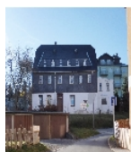
Fotonummer F 08967474 A Aufnahmejahr 2018 Beschreibung Wohnhaus, Ansicht von Osten