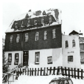
Fotonummer CV/76/25 Aufnahmejahr Fotograf Beschreibung