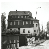
Fotonummer LVI/49/20A Aufnahmejahr 1997 Beschreibung Wohnhaus (Obergeschoss Fachwerk verschiefert)