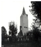
Fotonummer LXIX/12/10 Aufnahmejahr Fotograf Beschreibung