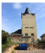
Fotonummer F 08963299 A Aufnahmejahr 2012 Beschreibung Wasserturm