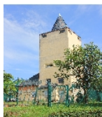
Fotonummer F 08963299 B Aufnahmejahr 2012 Beschreibung Wasserturm