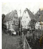
Fotonummer LXII/57/12 Aufnahmejahr Fotograf Beschreibung