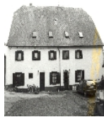
Fotonummer LXII/57/8 Aufnahmejahr Fotograf Beschreibung