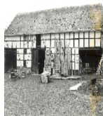
Fotonummer LXII/57/9 Aufnahmejahr Fotograf Beschreibung