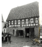
Fotonummer LXII/57/10 Aufnahmejahr Fotograf Beschreibung