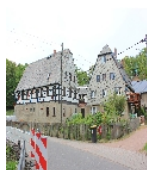
Fotonummer F 08961733 A Aufnahmejahr 2014 Beschreibung Vierseithof: Straßenansicht von Südosten