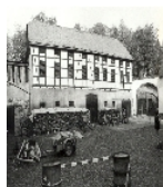
Fotonummer LXII/57/11 Aufnahmejahr Fotograf Beschreibung