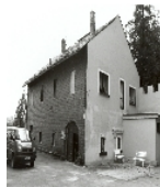
Fotonummer LXXXVII/15/3 Aufnahmejahr 2000 Beschreibung Wirtschaftsgebäude eines zum Kurheim ausgebauten Landgutes