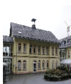
Fotonummer F 08958066 B Aufnahmejahr 2015 Beschreibung Wohnhaus, Wirtschaftsgebäude und Keller eines ehemaligen Kurheims, heute Altenpflegeheim