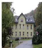
Fotonummer F 08958066 A Aufnahmejahr 2015 Beschreibung südliches Gebäude