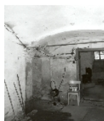
Fotonummer LXXXVII/15/5 Aufnahmejahr 2000 Beschreibung Nebengebäude (innen)