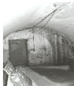
Fotonummer LXXXVII/15/2 Aufnahmejahr 2000 Beschreibung Keller