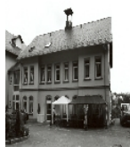
Fotonummer LXXXVII/15/4 Aufnahmejahr 2000 Beschreibung Hauptbau eines zum Kurheim ausgebauten Landgutes