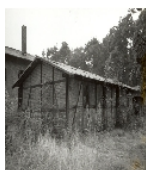
Fotonummer XLIV/98/4A Aufnahmejahr Fotograf Beschreibung