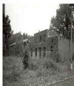
Fotonummer XLIV/98/3A Aufnahmejahr Fotograf Beschreibung