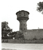
Fotonummer LXXVI/12/18A Aufnahmejahr Fotograf Beschreibung