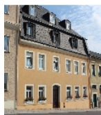
Fotonummer F 08956034 A Aufnahmejahr 2014 Beschreibung Wohnhaus in geschlossener Bebauung