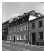
Fotonummer LXV/97/6 Aufnahmejahr 1998 Beschreibung Wohnhaus