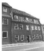
Fotonummer DF 426 753 Aufnahmejahr 1992 Beschreibung Wohnhaus