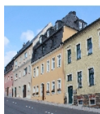
Fotonummer F 08956034 B Aufnahmejahr 2014 Beschreibung Wohnhaus in geschlossener Bebauung