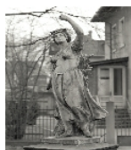
Fotonummer DF 739 996 Aufnahmejahr 1997 Beschreibung Rondell mit Figurengruppe, Jahreszeitenfigur des Sommers