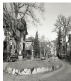
Fotonummer DF 739 992 Aufnahmejahr 1997 Beschreibung Rondell mit Figurengruppe