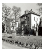
Fotonummer DF 739 993 Aufnahmejahr 1997 Beschreibung Rondell mit Figurengruppe