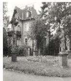
Fotonummer XXIII/17/6A Aufnahmejahr Fotograf Beschreibung Rondell