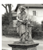
Fotonummer DF 739 994 Aufnahmejahr 1997 Beschreibung Rondell mit Figurengruppe, Jahreszeitenfigur des Frühlings