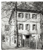
Fotonummer DF 718 859 Aufnahmejahr Fotograf Beschreibung