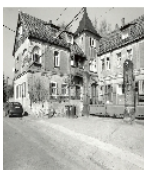
Fotonummer DF 718 863 Aufnahmejahr Fotograf Beschreibung