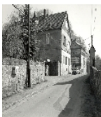
Fotonummer DF 718 860 Aufnahmejahr Fotograf Beschreibung